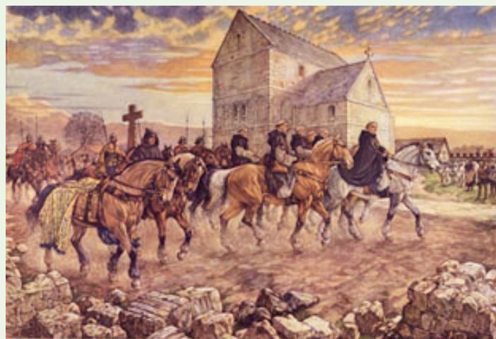
Willibrord, de apostel der Friezen

Zegt de naam Willibrord u iets, uit de vroege kerkgeschiedenis? Hij wordt ook wel de 'apostel der Nederlanden' genoemd, de 'apostel van de Lage Landen', de 'apostel van de Friezen'. Aan het einde van de 7 e eeuw (in 690) kwam de angelsaksische monnik Willibrord vanuit Ierland als missionaris, als zendeling naar onze contreien aan de zee – om aan de Friezen en de Saksen het evangelie te verkondigen, om op te roepen tot bekering, om te kerstenen. Hij werd ook de eerste bisschop van Utrecht, en na bijna 50 jaar van pragmatisch en doordacht werken in ons land stierf hij op 7 november 739 in Echternach, 81 jaar oud.