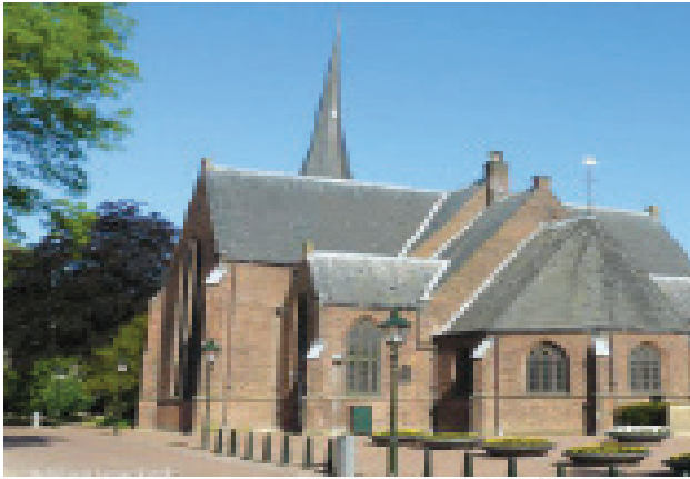
VAN DE PREDIKANT