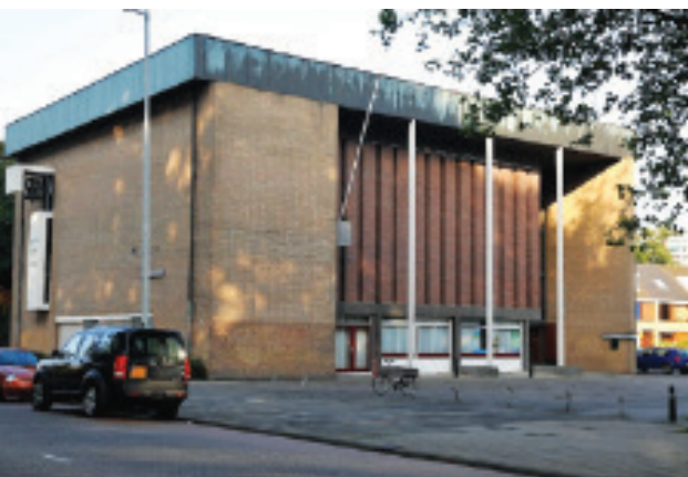
VAN DE PREDIKANT

Zondag 25 november is de laatste zondag van het kerkelijk jaar. Dan hoop ik zelf voor te gaan en zullen we stilstaan bij het uitzicht op een hoopvolle toekomst.